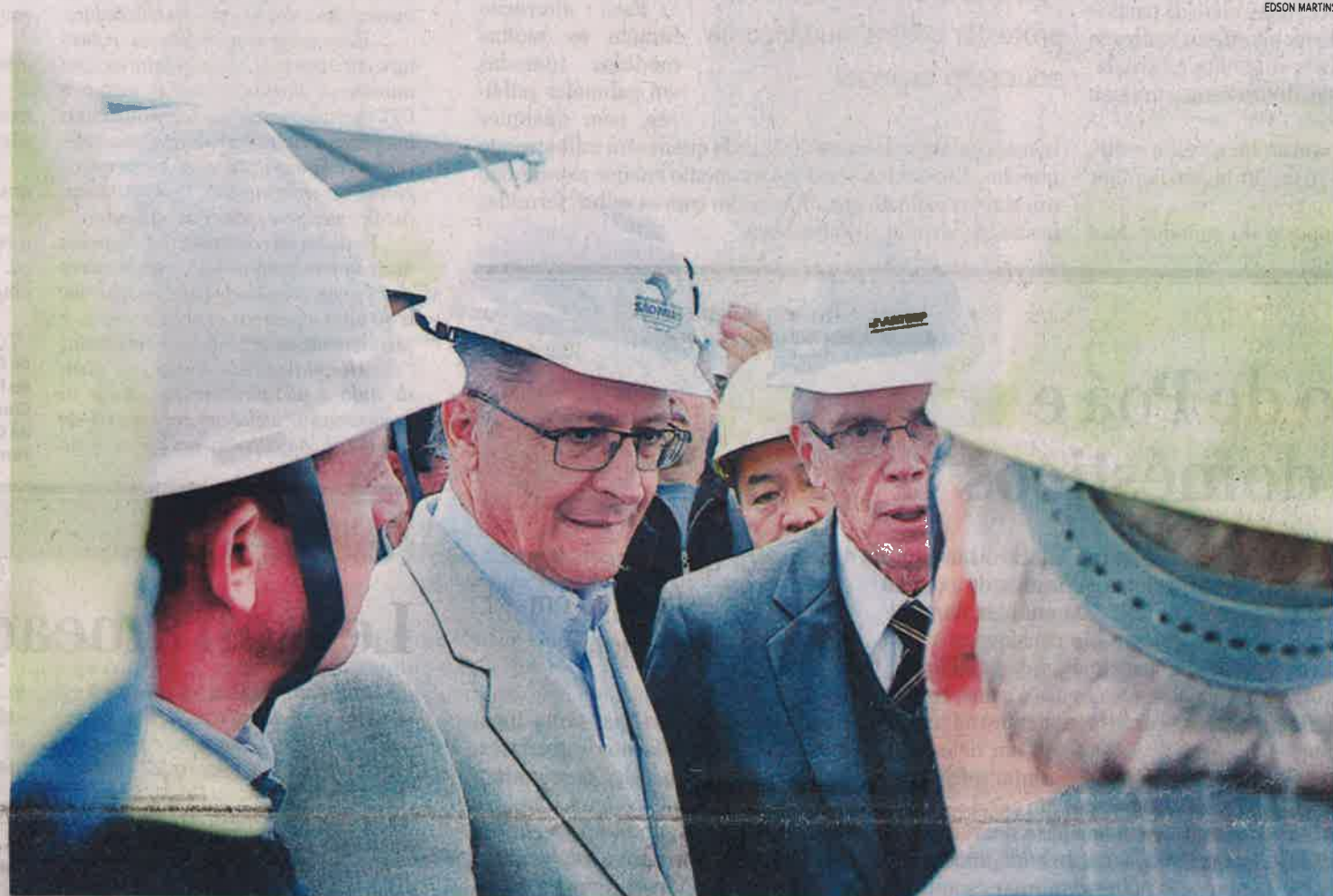
VISTORIA Governador Geraldo Alckmin foi informado por engenheiros responsáveis pela obra do Rodoanel na Região sobre a nova tecnologia

Governador Alckmin vistoriou serviços no Trecho Leste, entre Suzano, Poá e Itaquaquecetuba