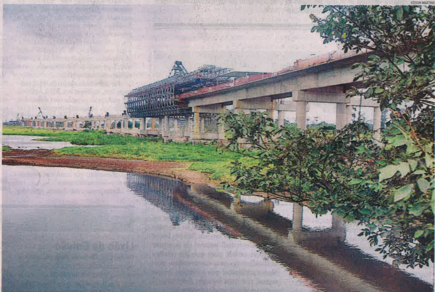
EM EXECUÇÃO Os equipamentos dotados de nova tecnologia permitem agilizar a construção de viaduto com menor impacto ambiental